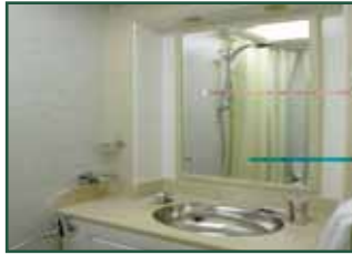
Ducha y WC privado